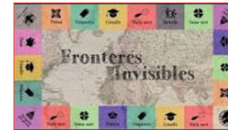
Joc de Taula. Fronteres Invisibles

Per un públic general: infants, joves, persones adultes, gent gran, educadors... Plaça La Sedeta.