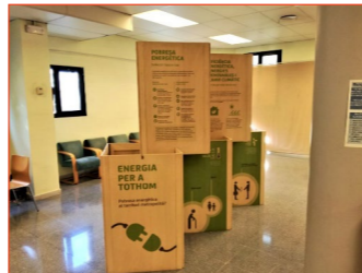
Exposició “Energia per a Tothom”

Taula temàtica de títols al voltant dels reptes i il·lusions de les i els joves, i com ens afectaran els efectes del canvi climàtic, els límits del creixement i l'accés universal als recursos naturals. Consultar bibliografia a l'enllaç: https://lacanibal.net